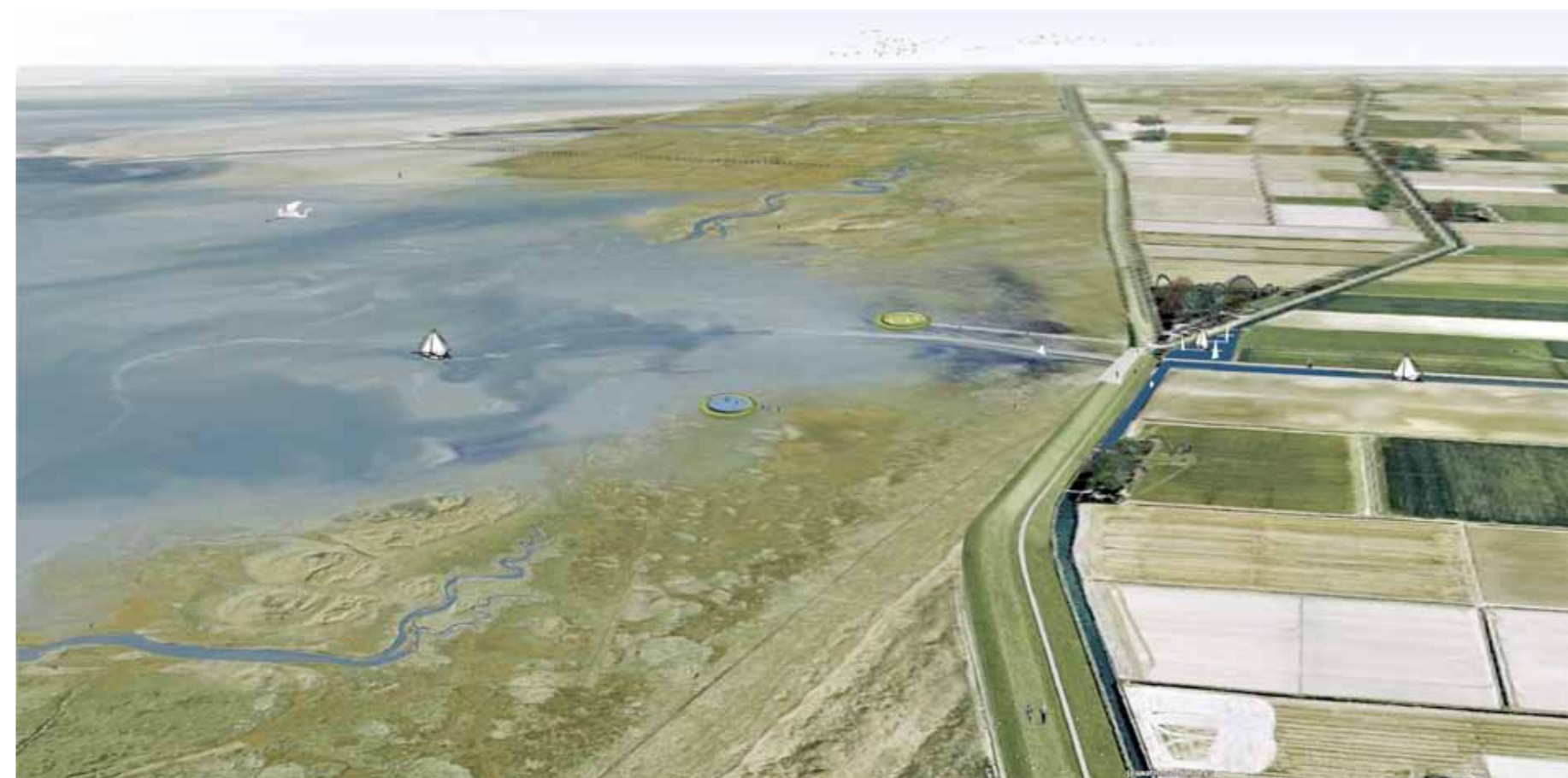
Impressie van het ontwerp voor de Waddenzeekust bij Zwarte Haan, met mogelijkheden voor gemaal met sluis en kamperen en zwemmen in de buitendijkse dobbe. (Impressie: Buro Harro)

Relaties en mogelijkheden van de waddenkust en het achterland. De kust wordt breed en robuust (boven). De recreatie- en doorvaarmogelijkheden verbeteren (midden). Ruimte voor 'zilte landbouw' (onder).