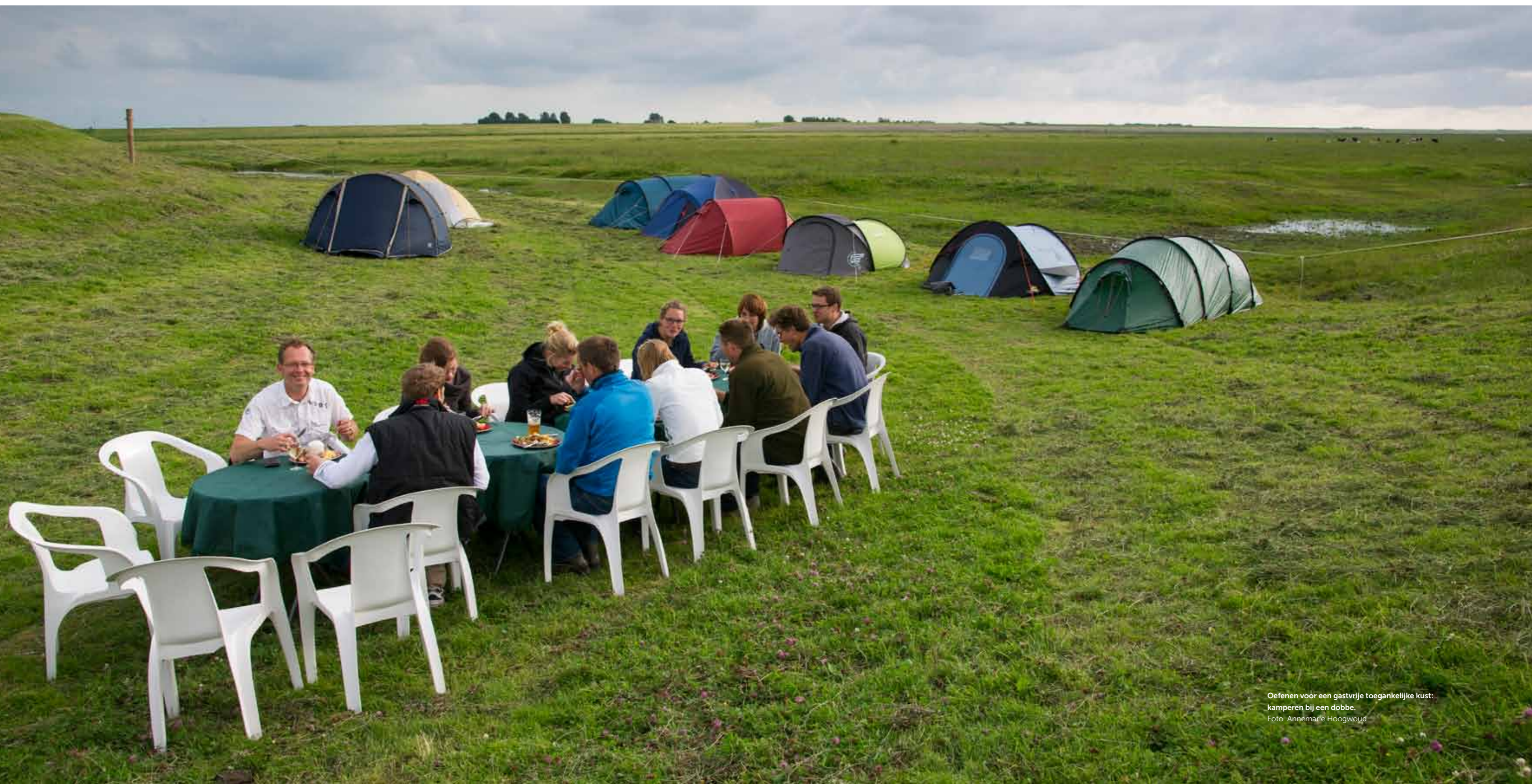
Oefenen voor een gastvrije toegankelijke kust: kamperen bij een dobbe.

weliswaar versterkt worden, maar door natte en droge kwelders als voorland te ontwikkelen kan de kust meegroeien met de verwachte zeespiegelstijging. Zo ontstaat uiteindelijk een brede, robuuste kustzone, waarbinnen de oorspronkelijke kustdynamiek terugkeert. De tweede pijler is omgaan met krimp. Door vergrijzing, het wegtrekken van jongeren en verpaupering van gebouwen staat de Wad-