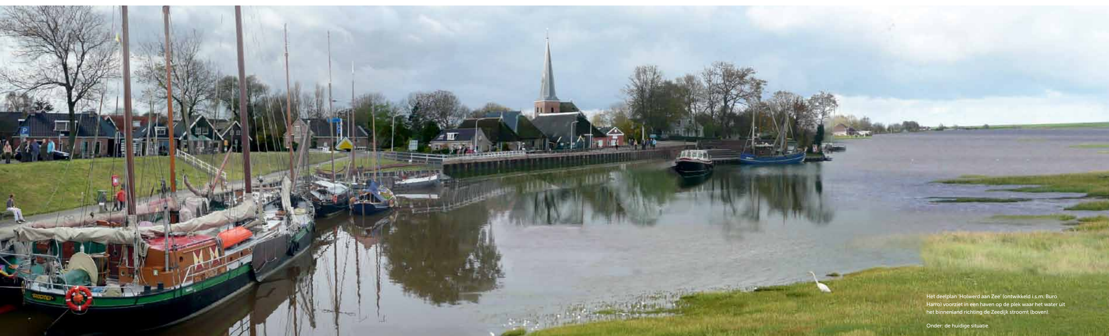
Het deelplan 'Holwerd aan Zee' (ontwikkeld i.s.m. Buro Harro) voorziet in een haven op de plek waar het water uit het binnenland richting de Zeedijk stroomt (boven). Onder: de huidige situatie.