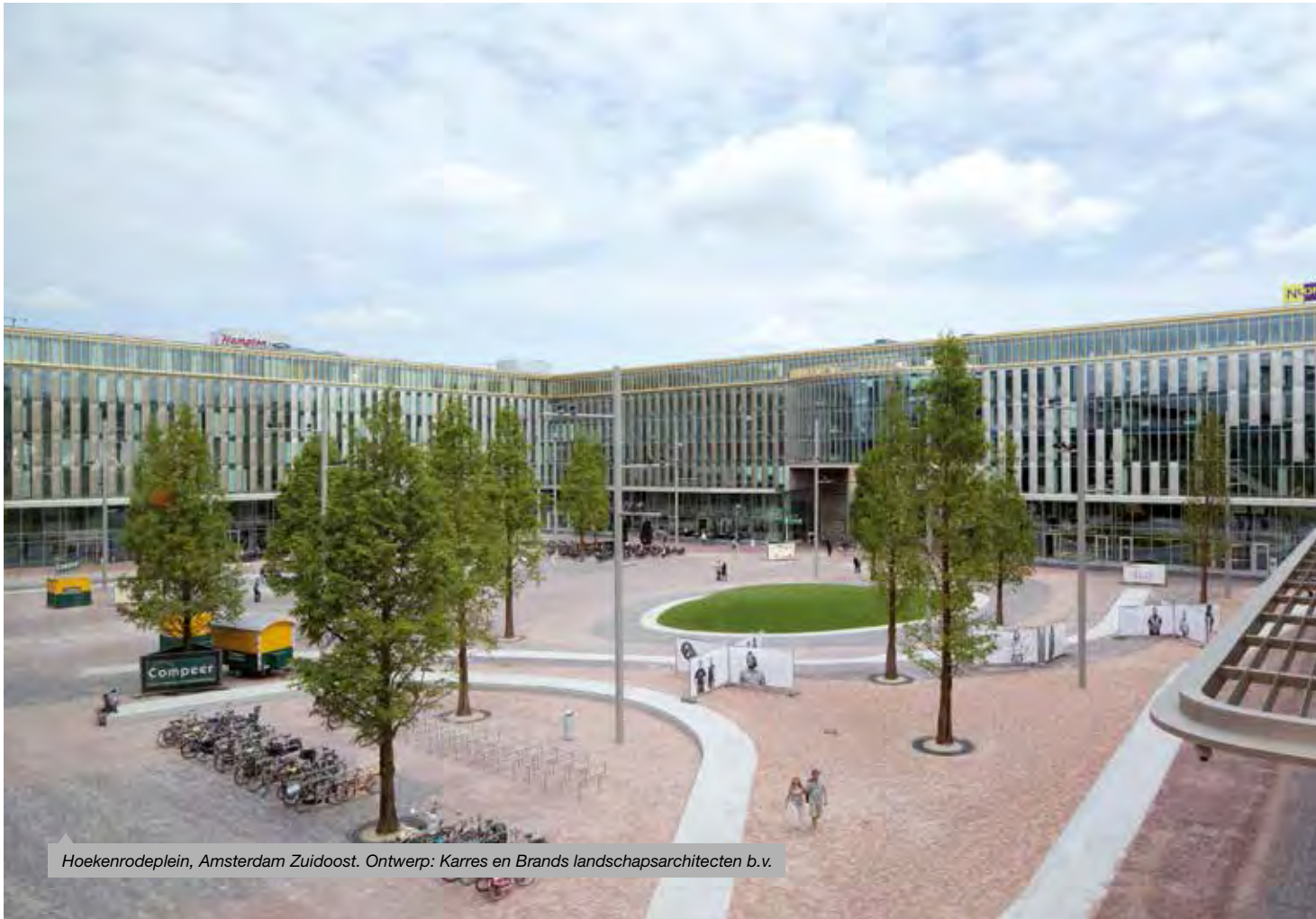
Hoekenrodeplein, Amsterdam Zuidoost. Ontwerp: Karres en Brands landschapsarchitecten b.v.