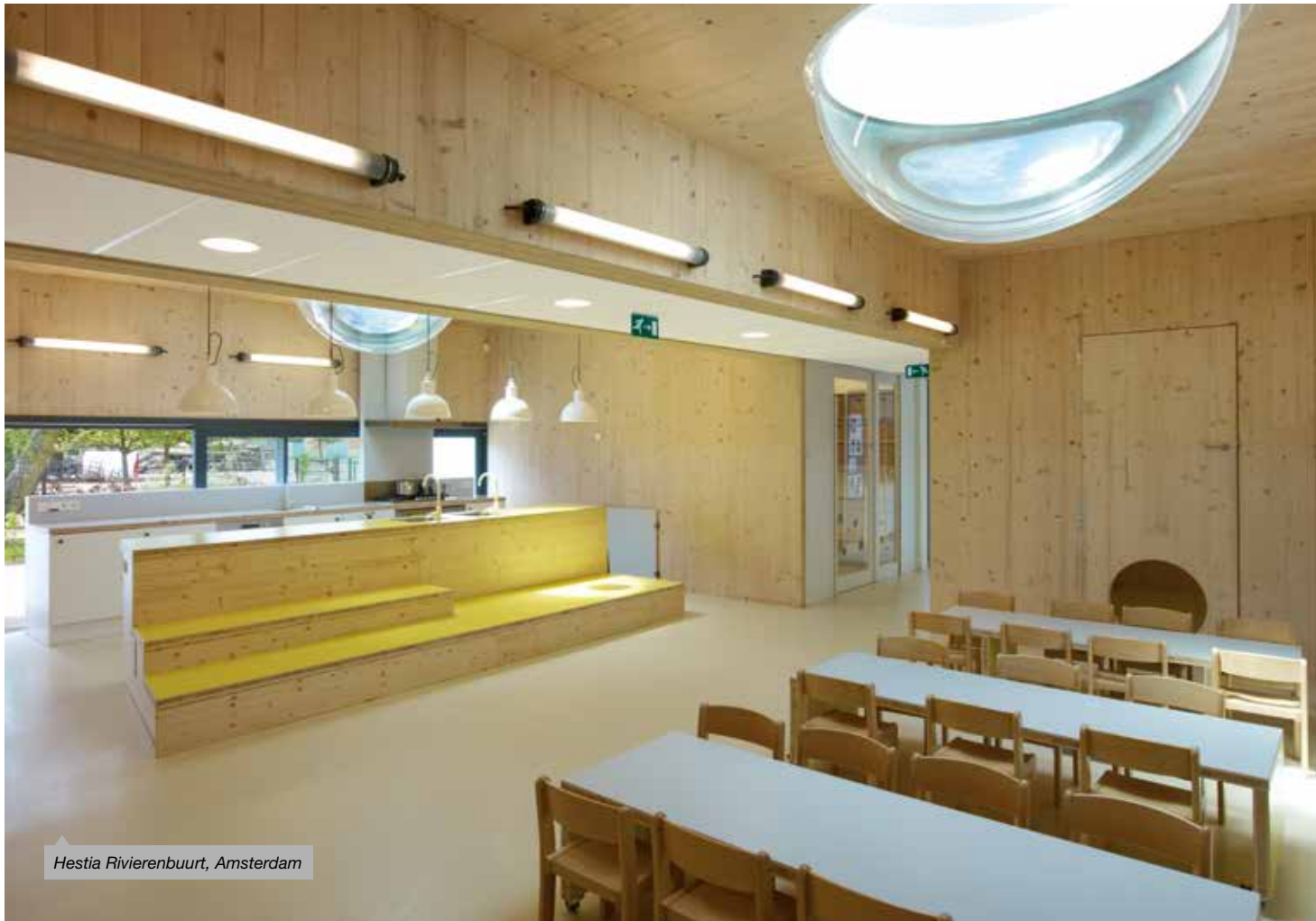
Hestia Rivierenbuurt, Amsterdam