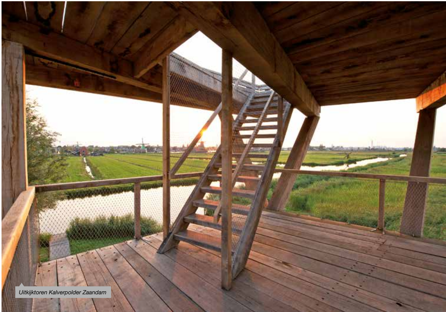
Uitkijktoren Kalverpolder Zaandam