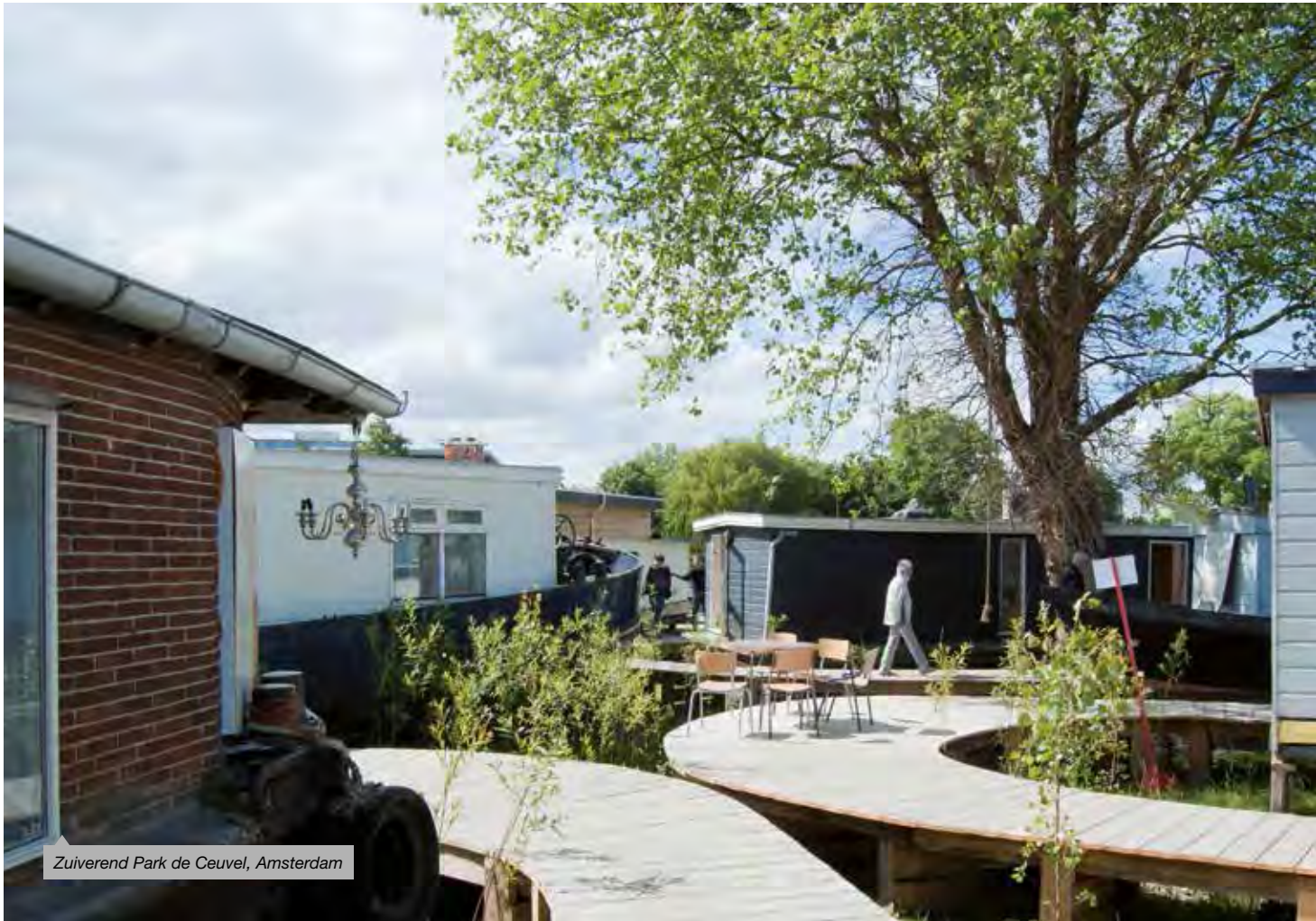
Zuiverend Park de Ceugel, Amsterdam