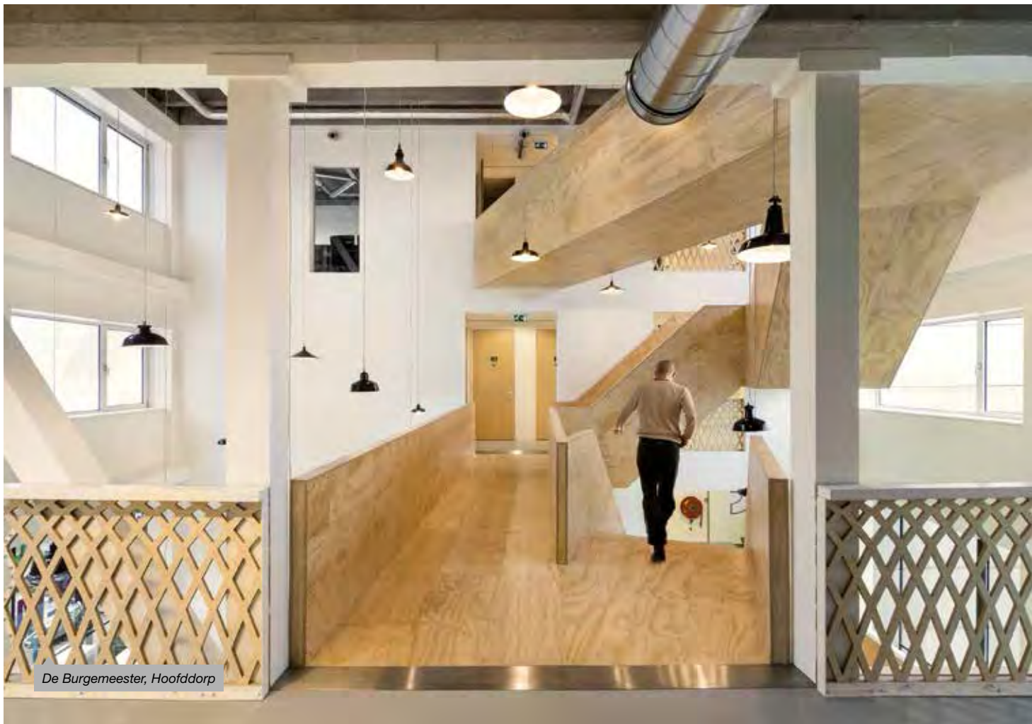
De Burgemeester, Hoofddorp