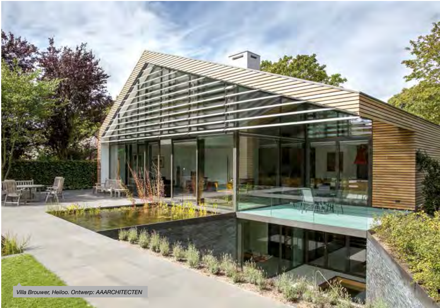
Villa Brouwer, Heiloo. Ontwerp: AAARCHITECTEN