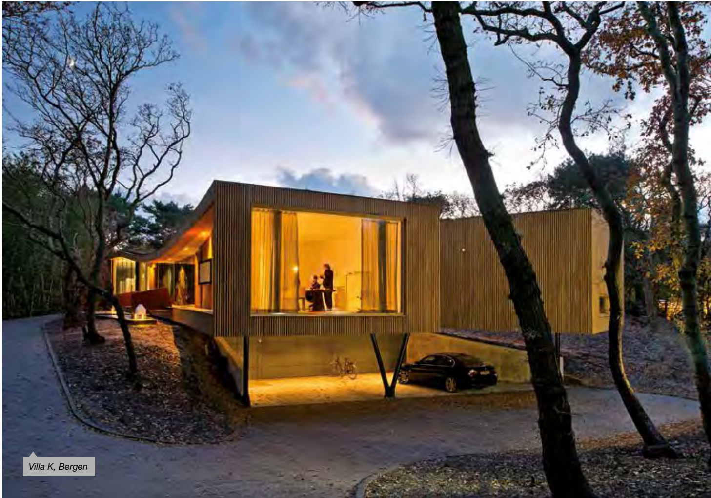
Villa K, Bergen