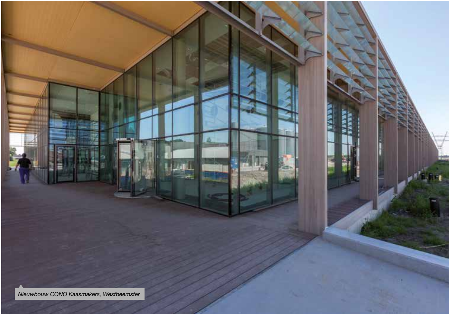
Nieuwbouw CONO Kaasmakers, Westbeemster