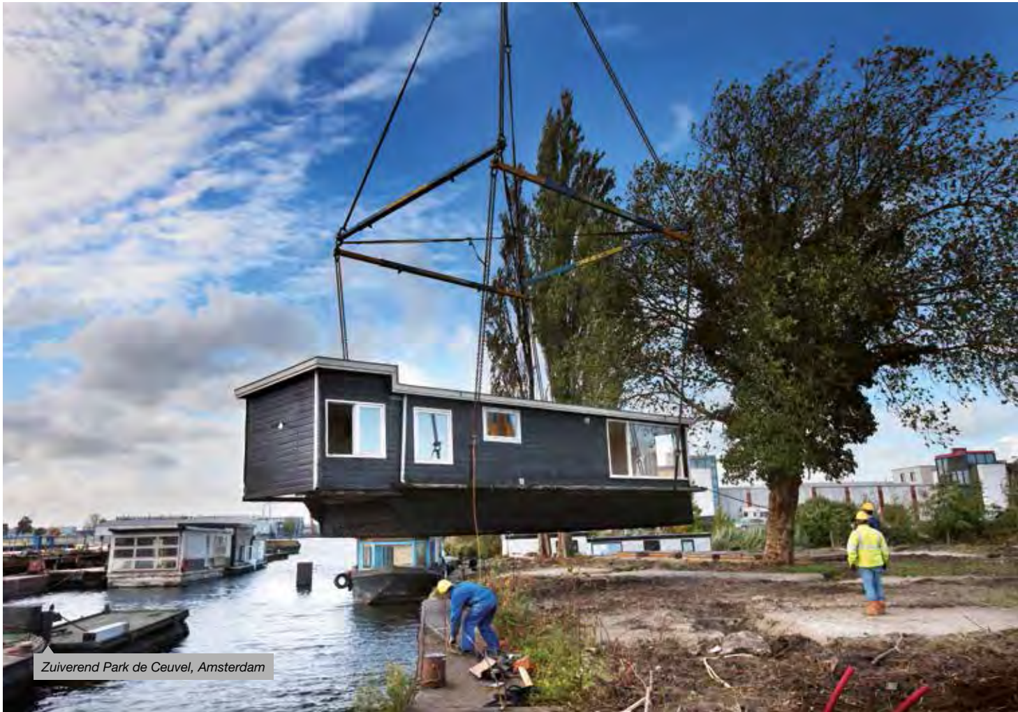
Zuiverend Park de Ceuvel, Amsterdam