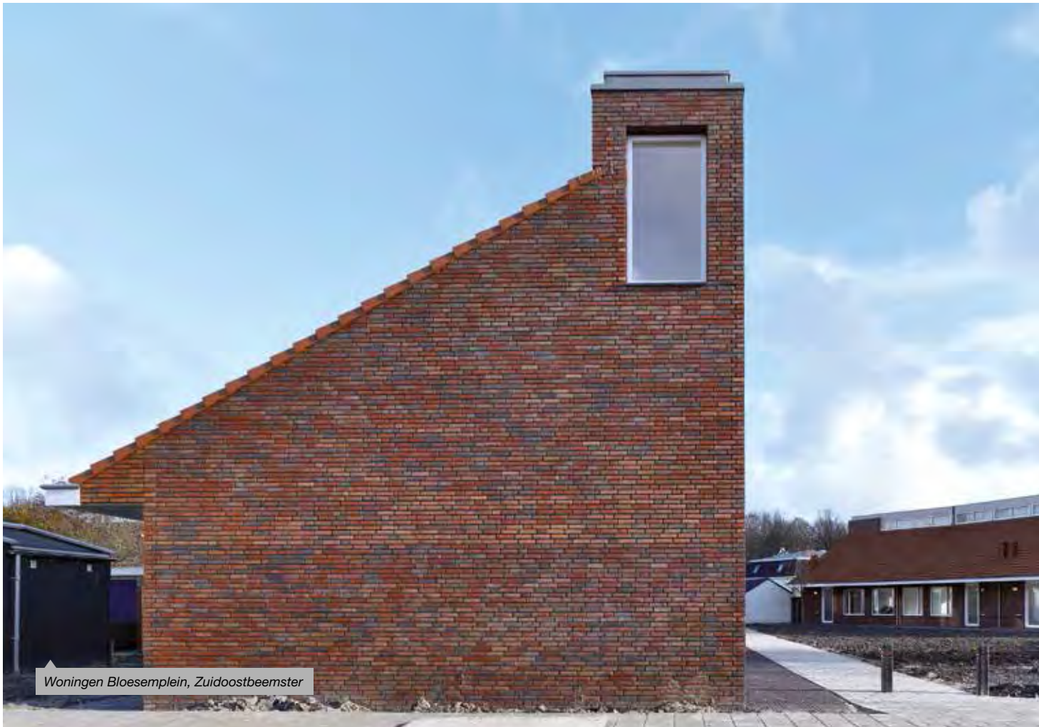
Woningen Bloesemlein, Zuidoostbeemster