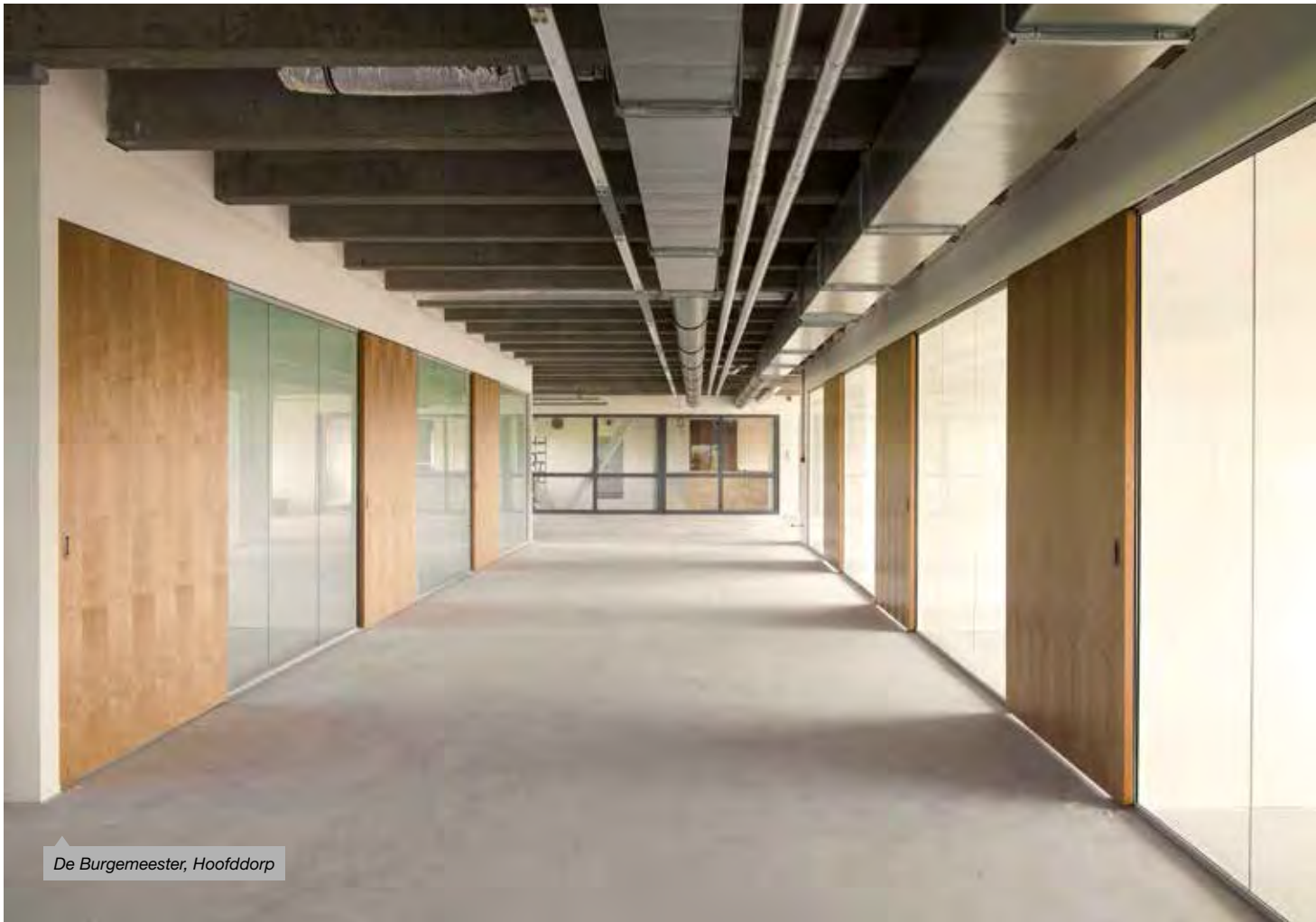
De Burgemeester, Hoofddorp