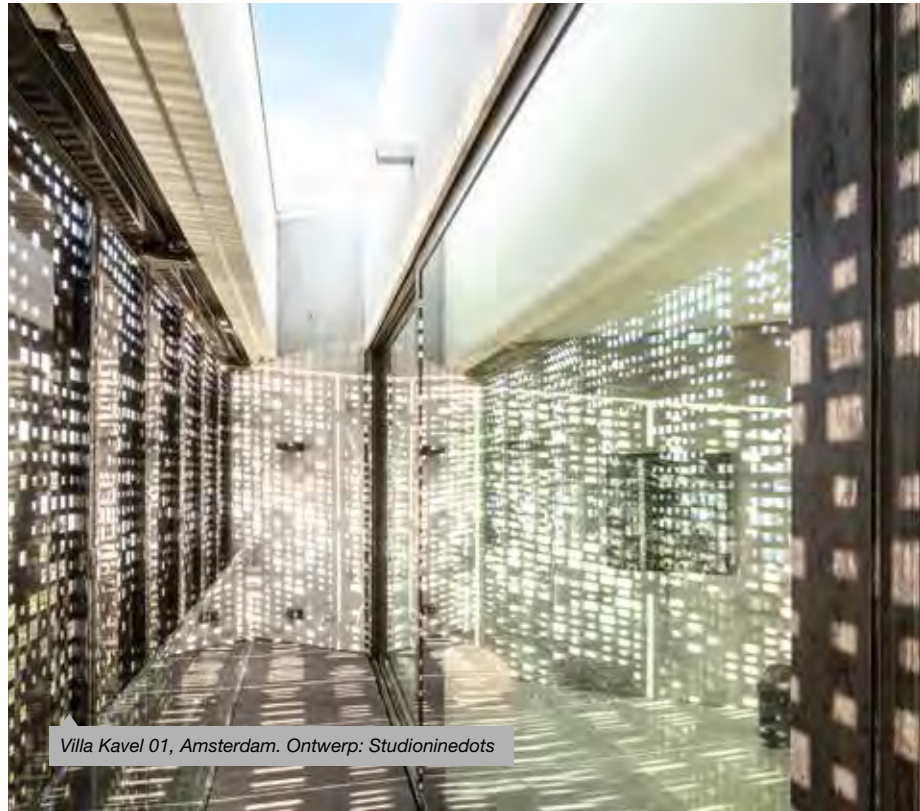
Villa Kavel 01, Amsterdam. Ontwerp: Studioninedots

Ook de seriematige woningbouw is een punt van discussie. Door de crisis en de daardoor veranderde mogelijkheden, is het lastiger geworden om grotere (woningbouw)projecten te realiseren. Dat is een zorgwekkende ontwikkeling; juist met deze omvangrijke projecten kunnen de ruimteproblemen van grote steden structureel worden opgelost. Hoewel de grotere woningbouwprojecten enigszins onderge-