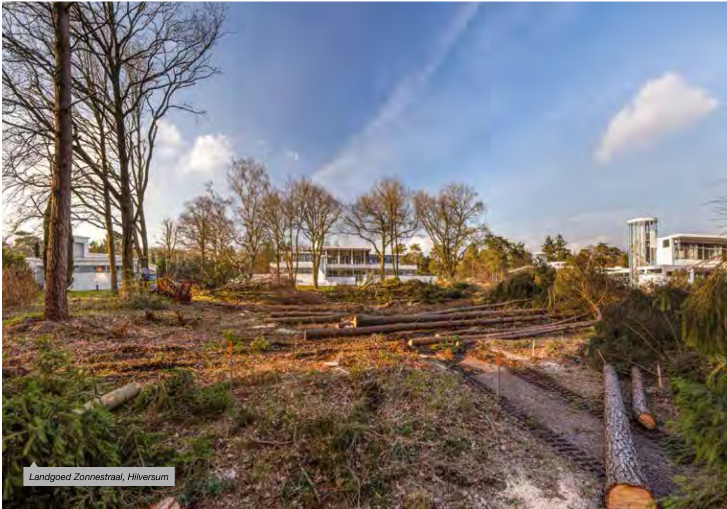
Landgoed Zonnestraal, Hilversum