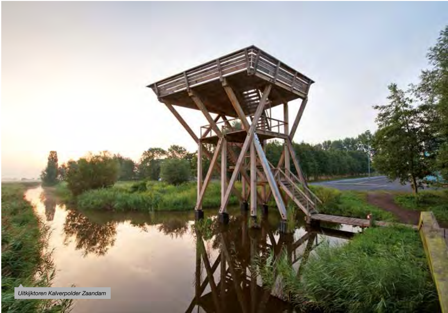
Uitkijktoren Kalverpolder Zaandam