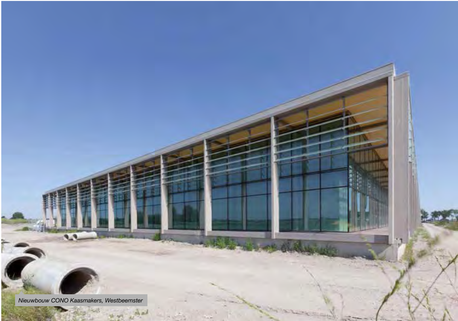
Nieuwbouw CONO Kaasmakers, Westbeemster