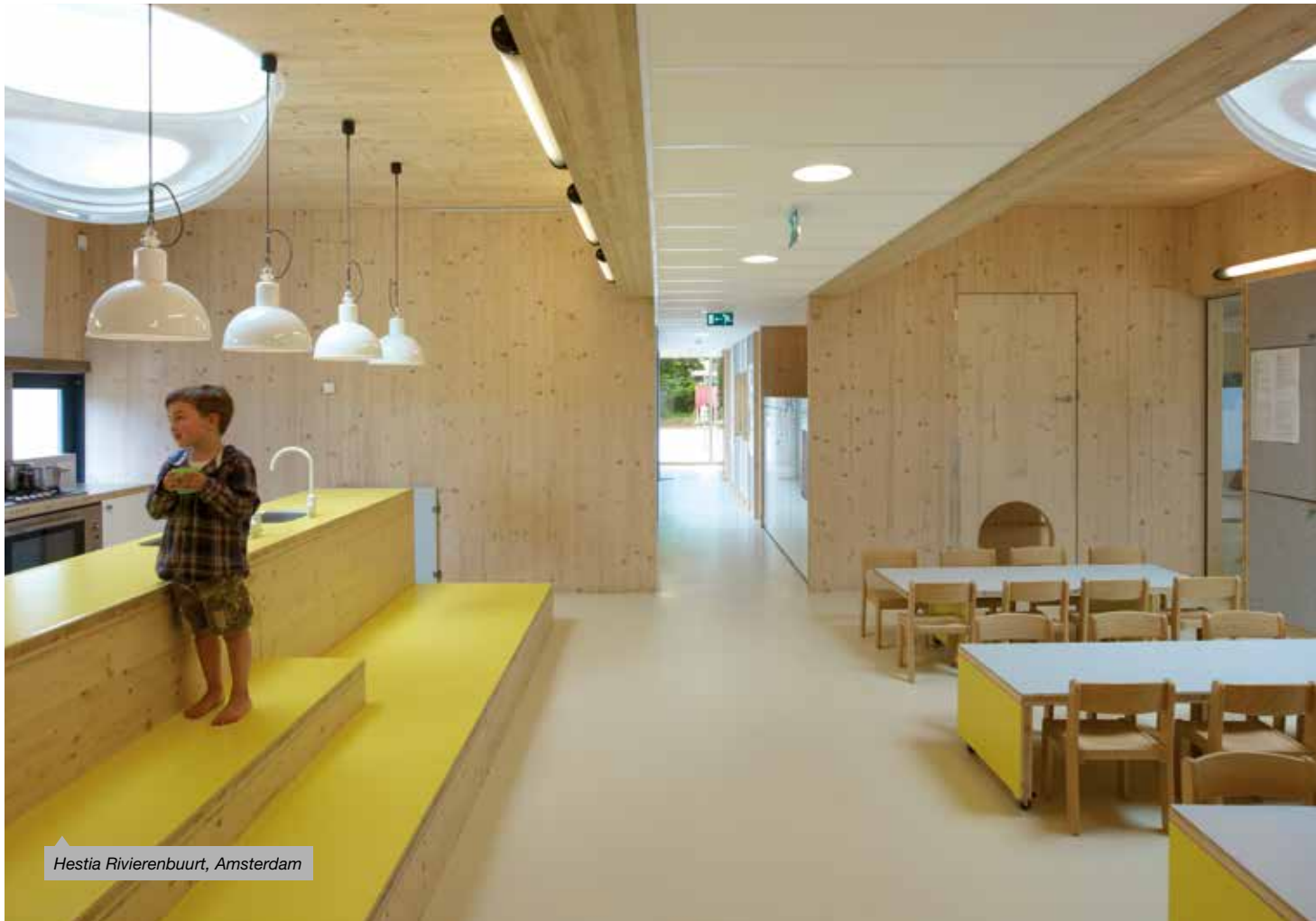
Hestia Rivierenbuurt, Amsterdam