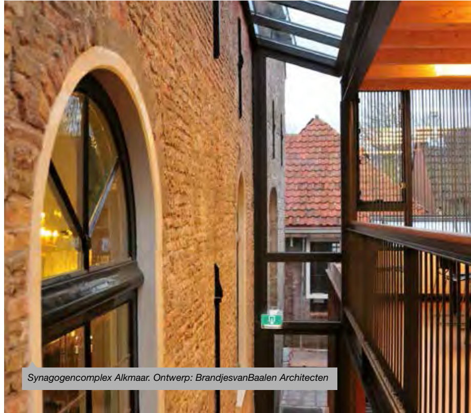
Synagogencomplex Alkmaar. Ontwerp: BrandjesvanBaal Architecten

Ook het agrarisch ensemble in Watergang maakt door het agrarische, no-nonsens karakter indruk. De gerenoveerde boerderij ademt