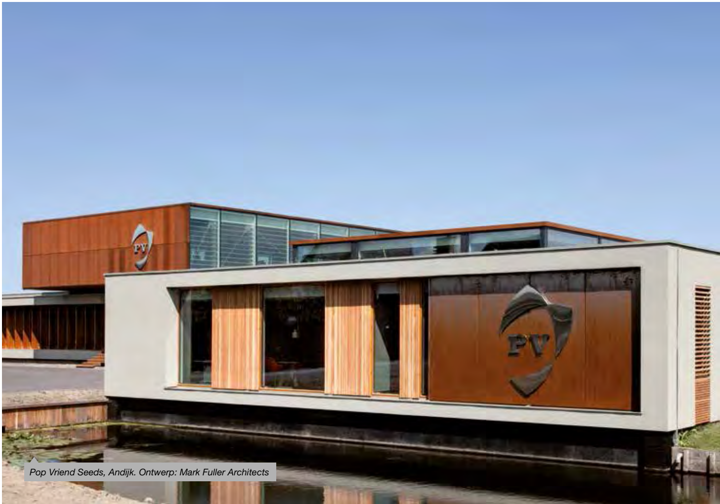
Pop Vriend Seeds, Andijk. Ontwerp: Mark Fuller Architects