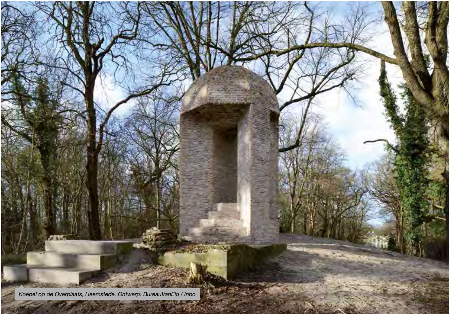
Koepel op de Overplaats, Heemstede. Ontwerp: BureauVanEig / Inbo