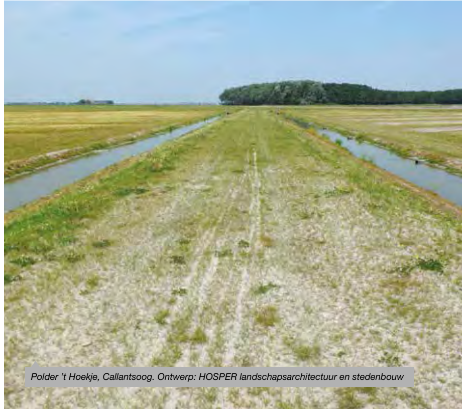
Polder 't Hoekje, Callantsoog. Ontwerp: HOSPER landschapsarchitectuur en stedenbouw

Ook binnen deze categorie ziet de jury enkele opvallende tendensen. Zo zijn er inzendingen die meer een strategie presenteren dan een ruimtelijk plan. Het gaat om initiatieven die zich richten op het activeren van plekken, kleinschalig en bottom-up . Mooie voorbeelden zijn de Ceuvel in Amsterdam Noord en de Zeespiegel in Hoorn. Een andere actuele opgave is die van waterbergingsgebieden. Door de klimaatverandering krijgen we de komende tijd te maken met grote verschillen: van extreme droogte tot zware regenval. Polder 't Hoekje in Callantsoog laat op een uitstekende manier zien hoe een ontwerper met deze problematiek kan omgaan. Een rustig, monofunctioneel project, zonder opsmuk.