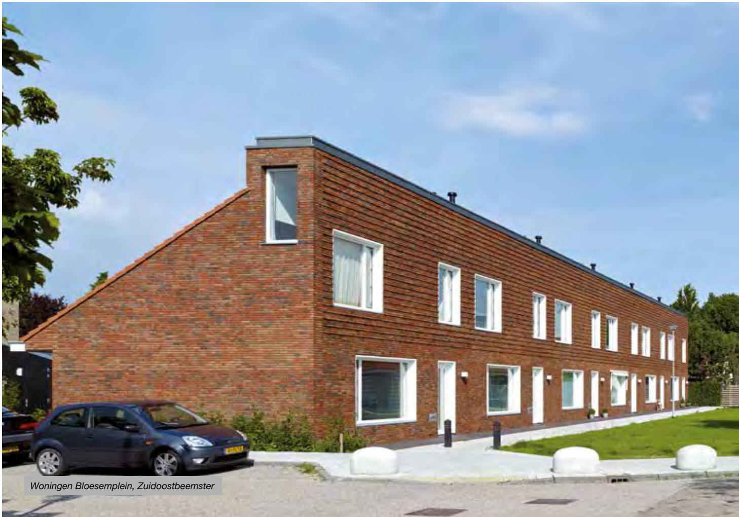
Woningen Bloesemlein, Zuidoostbeemster