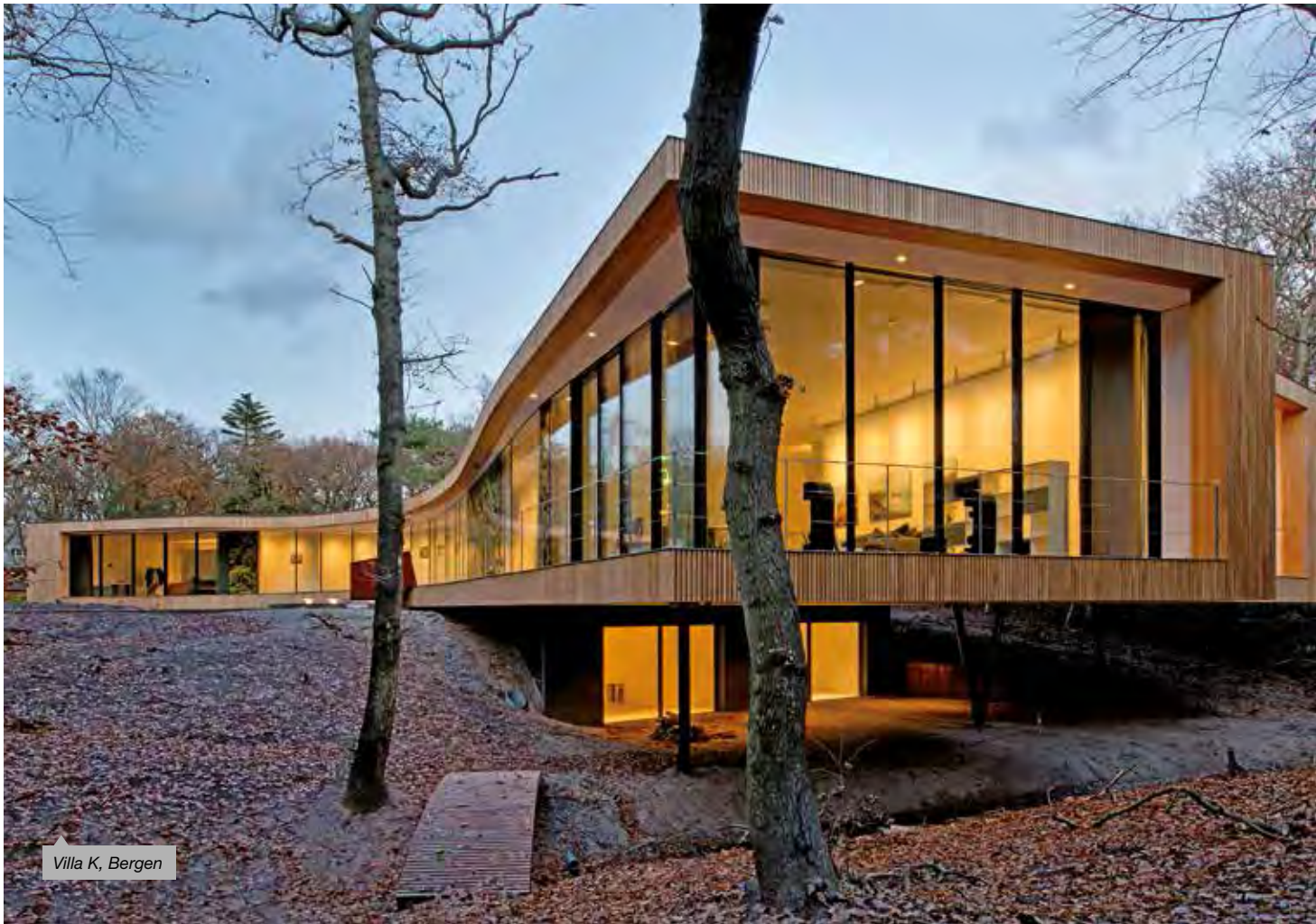
Villa K, Bergen