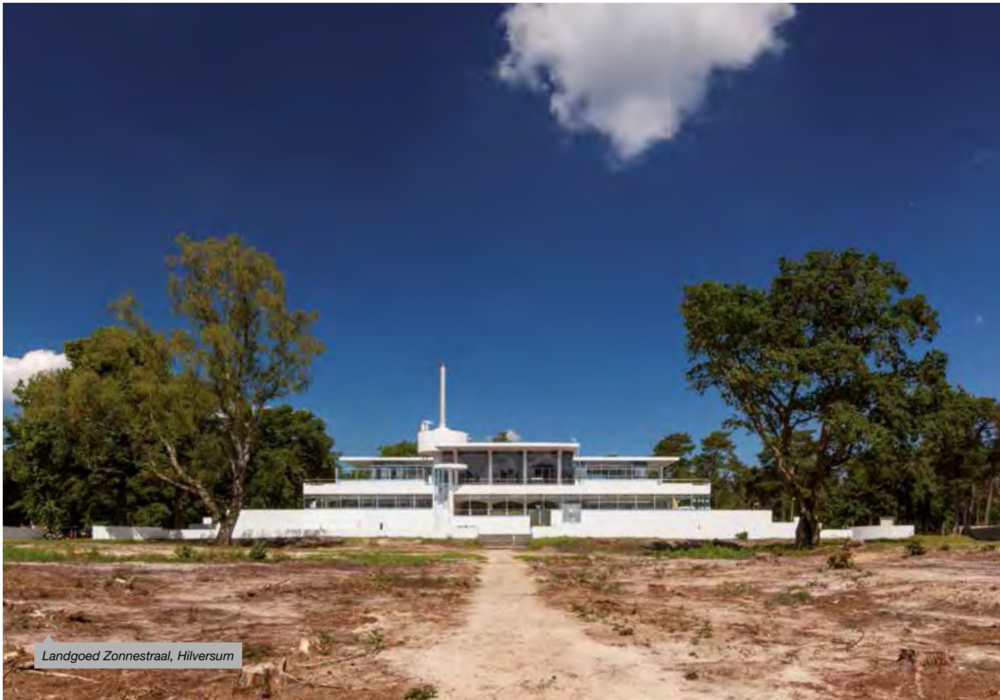
Landgoed Zonnestraal, Hilversum