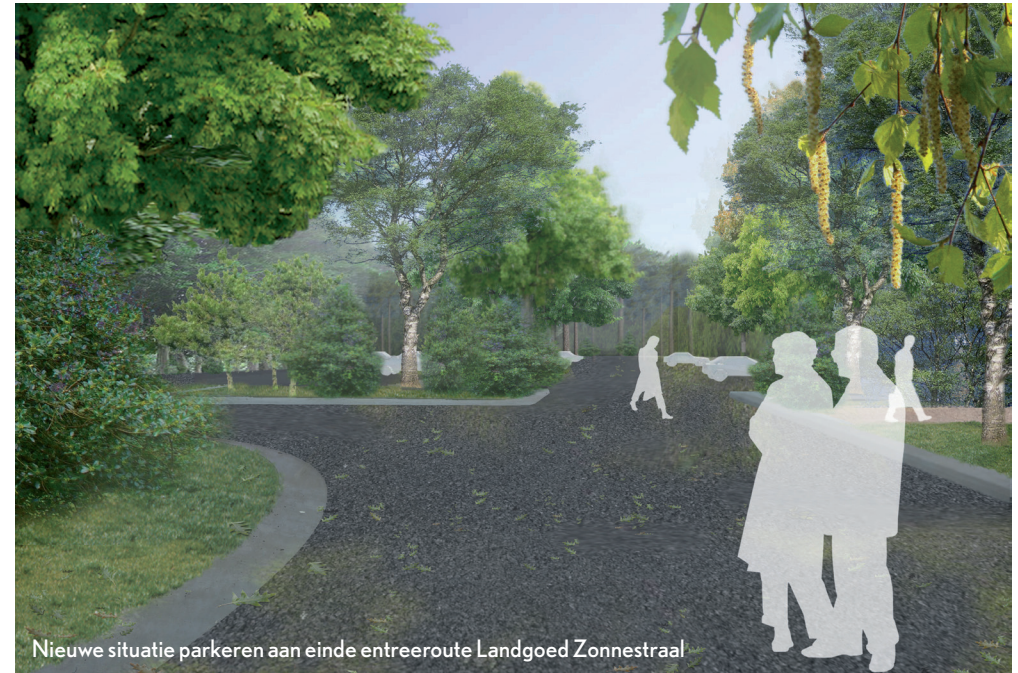
Nieuwe situatie parkeren aan einde entree route Landgoed Zonnestraal