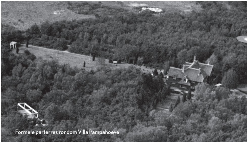
Formele parterres rondom Villa Pampahoeve

Tenslotte is in het Ruimtelijk Plan een nieuwe routing voorzien. De hoofdroute leidt de bezoeker in een doorgaande beweging naar het ensemble van Duiker. Het parkeren, dat tot dusverre verspreid plaatsvond, is geconcentreerd in een aantal parkeerkamers terzijde van de route. De parkeerkamers worden omringd door hulst, lijsterbes en grove den, de van nature voorkomende bosbeplanting. De parkeerplaatsen zelf zijn uitgevoerd in halfverharding passend bij de bosrijke omgeving.